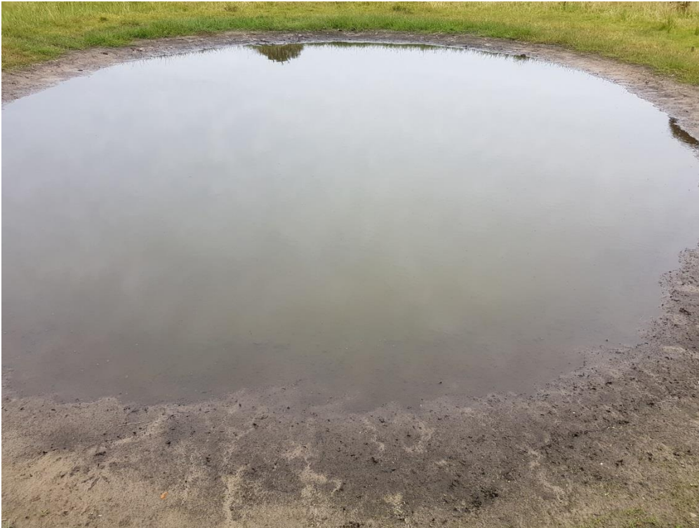
Figur 4. Foto taget af søen den 25. juli 2017. Viser vandets klarhed og det eksponerede mudder.

Søen er før ansøgning om oprensning sidst besøgt den 12. august 2011 af konsulentfirmaet Aglaja (Figur 5). Ved denne besigtigelse skrev de: