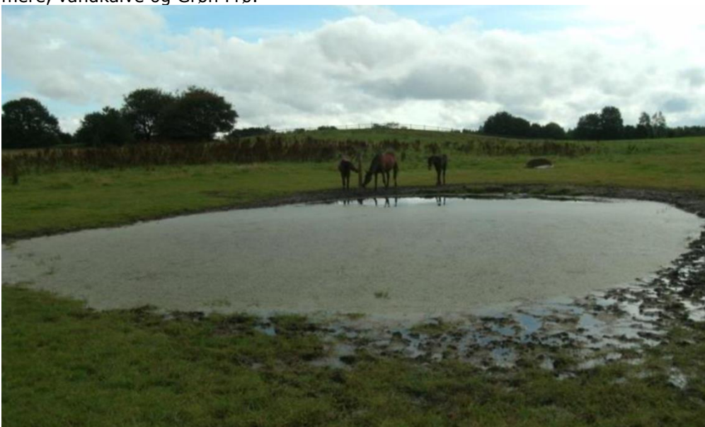
Figur 5. Foto fra den 12. august 2011.

Naturtilstanden blev estimeret til moderat og eneste plejebæhov var for en ned-sættelse af eutrofiering. 16 plantearter blev registreret samt døgnfluer, rygsvøm-mere, vandkalve og Grøn Frø.