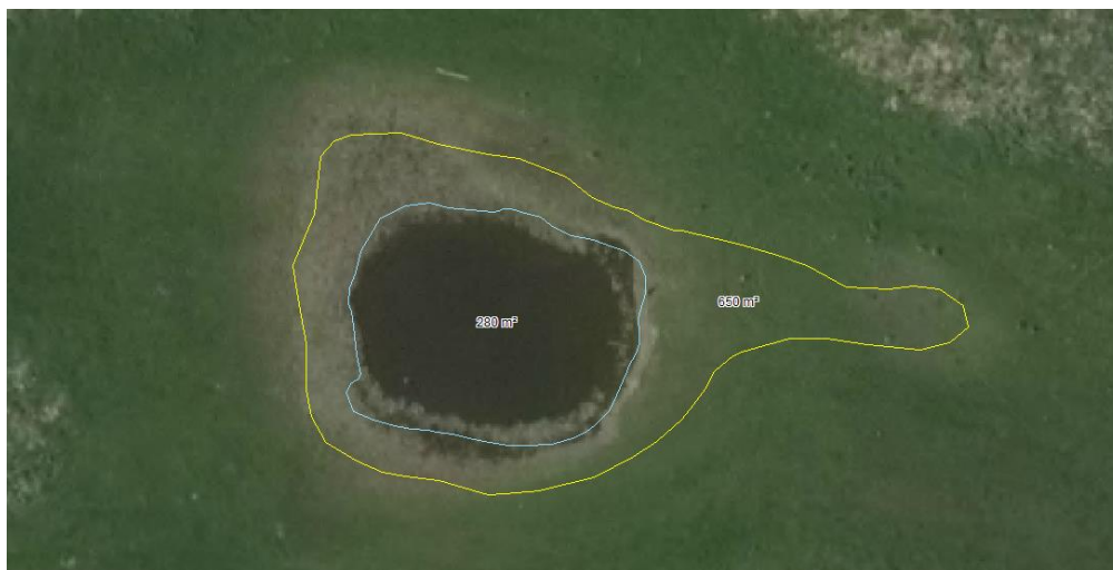
Figur 2. Luftfoto fra 2016 der viser den nuværende størrelse af søen (lyseblå) og den foreslåede ændring af søen (gul). Ændringen er tegnet efter højdekurver og luftfotos fra våde år. Blå polygon er 280 m 2 imens gul er 650 m 2 .