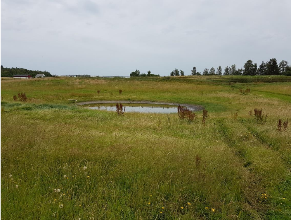
Figur 3. Foto taget af søen den 25. juli 2017. Viser placering i landskabet.

Undertegnede besigtigede også søen den 23. maj 2016, hvor søen fremstod på samme måde, men med højere vandstand og efterladenskaber fra gæs omkring.