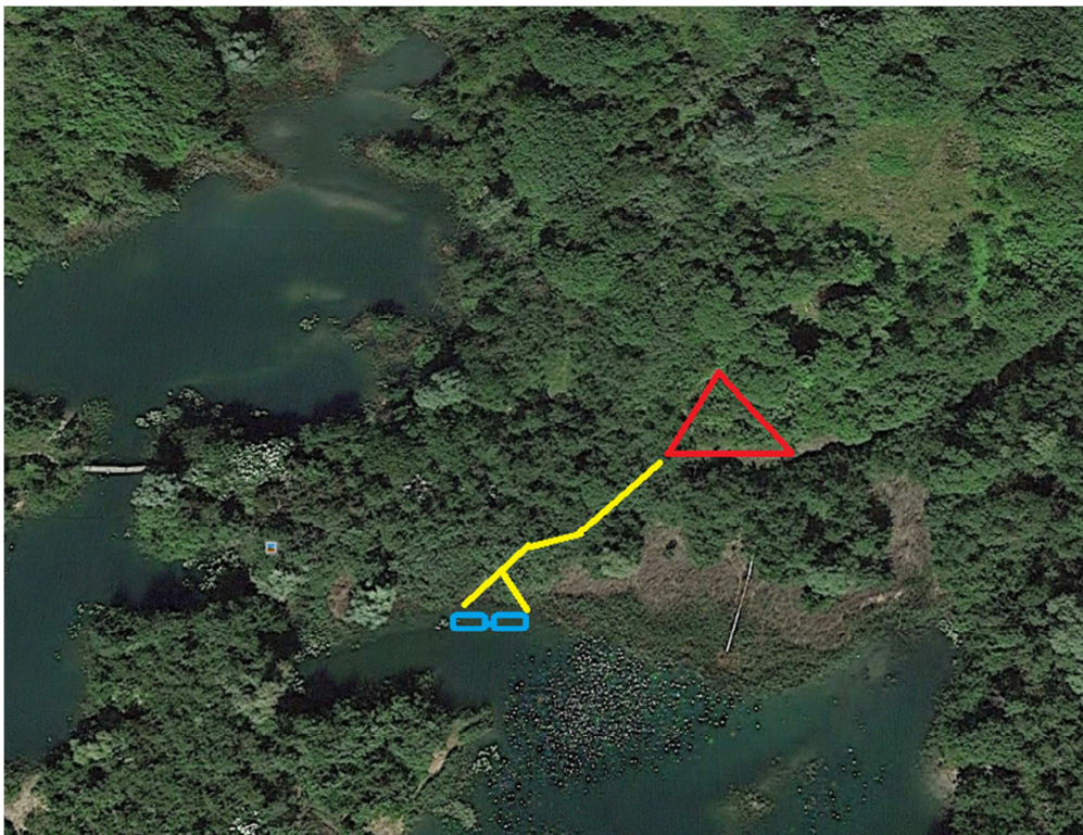
Figur 2. Nivå Nu's søplateau projekt. Rød trekant er siddeplateau, gul er træbro og blå er flydepontoner.

søen (Figur 2). Kun dele af projektet er omfattet af denne dispensation, da kun de to flydepontoner samt en del af træbroen etableres indenfor det §3 beskyttede område.