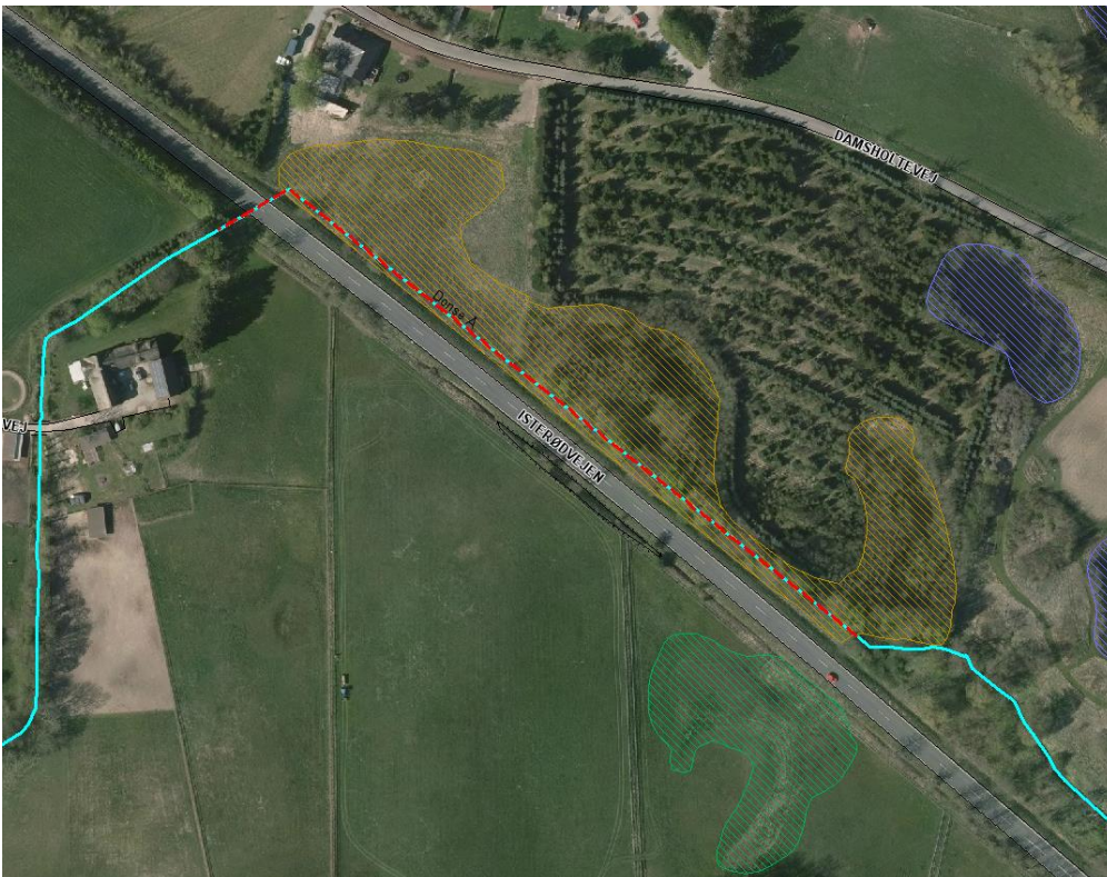
Figur 1. Den rødstiplede linje er det rørlagte vandløb og det brunskraverede areal nordøst for vandløbet er §3 beskyttet mose

Fredensborg Kommune får hermed tilladelse til genåbning af rørlagt strækning på Donse Å, matrikel 1a og 7h, Gunderød By, Karlebo. Det rørlagte forløb ses på Figur 1 og det genåbnede ses på Figur 2.