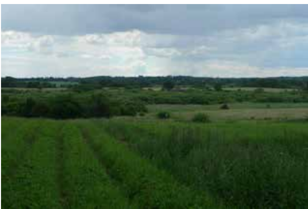
Åbent kig mod Langstrup Mose i den østlige ende af landsbyen.

De åbne kig til Langstrup Mose er sårbare over for beplantning med skov.