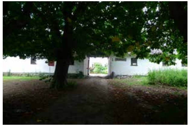
Draghøjgaard er en af de fire gårde, som endnu ligger i landsbyen. Den gamle katasnieallé ind til gården understreger oplevelsen af oprindelighed.

I de følgende år opstod en stram, reguleret bebyggelse med huse i stedet for de udflyttede gårde og i løbet af 1800 tallet blev den nordligste af de tilbageværende gårde nedlagt, hvorved bebyggelsen i det store og hele fik den form, der ses i dag. Enkelte nye huse er kommet til og ved den østlige gård er nye bygninger opført lige nord for den oprindelige gård.