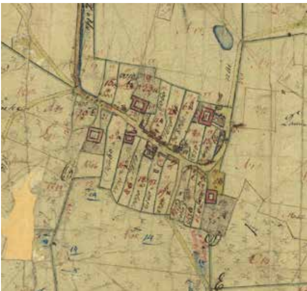
Udsnit af udskiftningskort fra 1788 (øverst) og Original 1 kort gældende fra 1816. Sammenligner man de to kort ses det tydeligt, hvor dramatisk udskiftning og udflytning inden for ganske få år ændrede byens bebyggelse.

Den meget effektive udskiftning betød, at hele 17 af de 22 gårde måtte udflyttes - der blev trukket lod om, hvilke gårde der måtte blive i landsbyen. Tilbage i byen blev udover de fem gårde kun enkelte huse langs landsbygaden. Den effektive udskiftning og store udflytningsgrad skal måske ses i lyset af, at landsbyen hørte under Kronborg Amt.