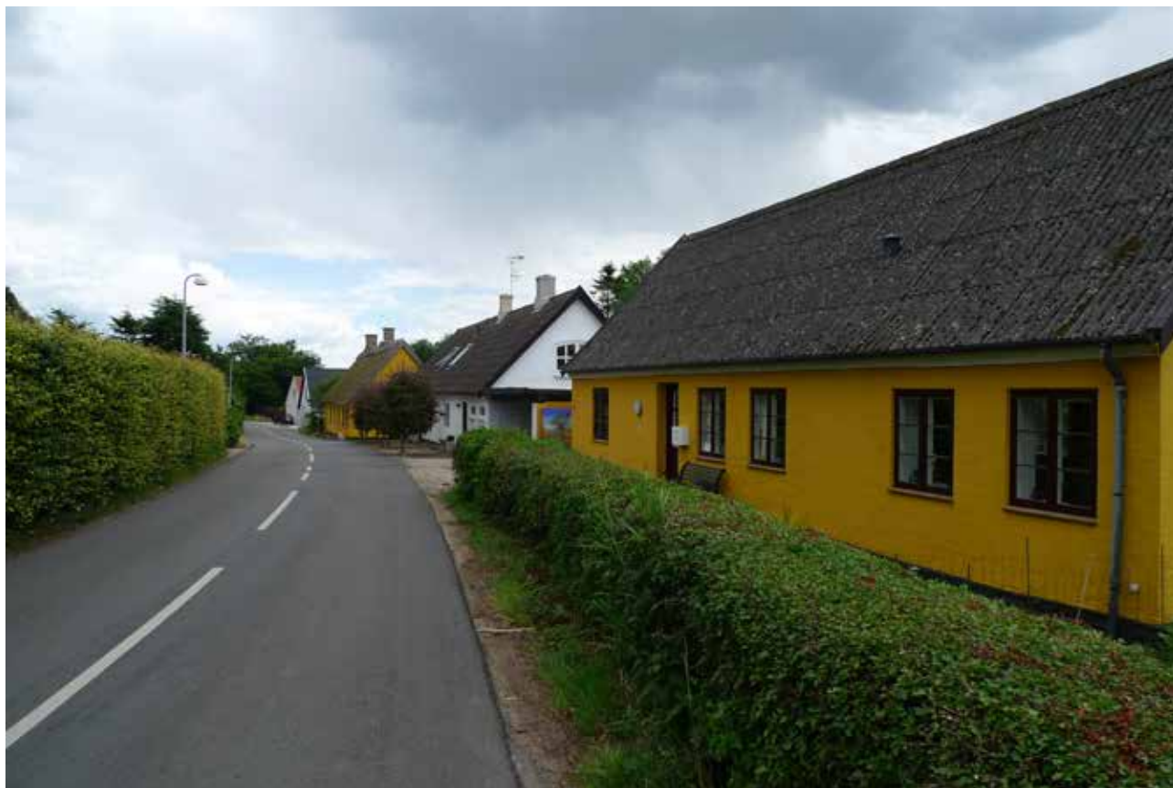
Rækken af mindre håndværker- og landarbejderhuse er et centralt karaktertræk i Langstrup.

På de bevarede gårde er det en udfordring at anvende gårdenes driftsbygninger i takt med at gårdene ikke længere indgår i landbrugsmæssig drift. Der kan derfor opstå ønske om nedrivning, hvilket vil ændre landsbyens fortælleværdi markant.