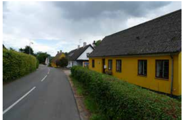
Den stramt regulerede struktur af huse langs landsbygaden er især tydelig på sydsiden.