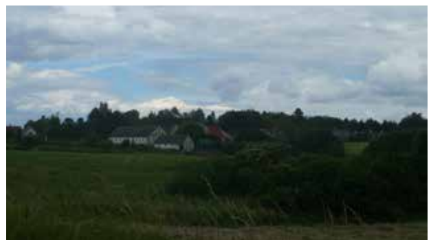
Træplantningen nord for byen understreger bakken og byens beliggenhed på overgangen mellem mose og morænebakke.

Den præcise placering mellem mose og morænebakke opleves tydeligt, når man færdes i byen. Landsbygaden følger terrænet og mellem bygningerne er der flere steder lange kig mod de flade enge i mosen, mens bakken bag byen fremstår træklædt.