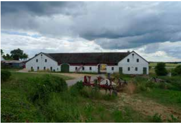
Driftsbygningerne er et markant element i landsbymiljøet.

De åbne kig til Langstrup Mose er sårbare over for beplantning med skov.