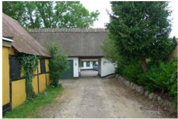
Selvom mange af husene er ret ombyggede, er der også bevaret mange fine, fortællende detaljer.

Bygningsarkitektonisk er det især de to bevarede firlængede gårde, der påkalder sig interesse.