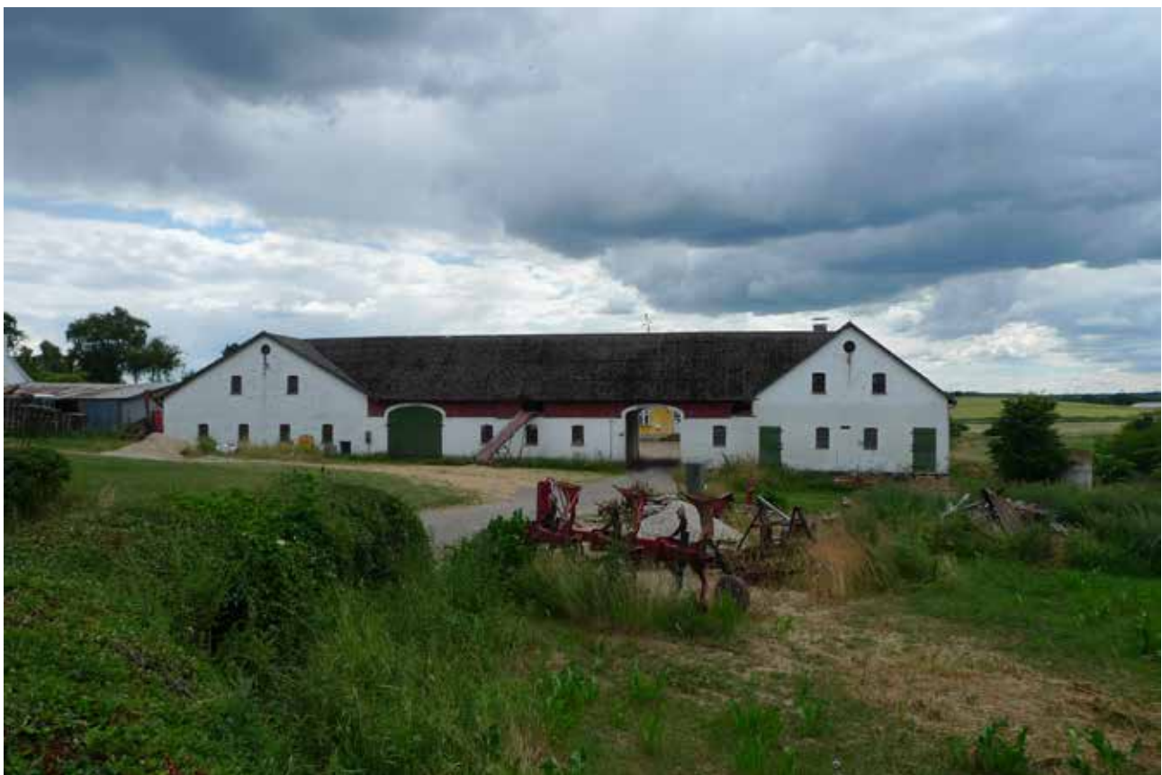
Brønsbjerggård ligger frit i landskabet med sin markante facade med to porte og karakteristiske gavle.

Kilder: Johs. T. Christensen: Fra Udskiftningstiden i Nordsjælland : Langstrups og Dauglykkes Udskiftning (I: Fra Frederiksborg Amt, årg. 7 (1912), S. 105-29, ill.)