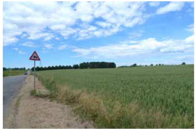
Kig ud over det letbølgede morænelandskab nordvest for Langstrup.

Placeringen på kanten af mosen gav landsbyen let adgang til både eng og tørv i mosen samt dyrkede marker og overdrev på morænefladen nord for byen.