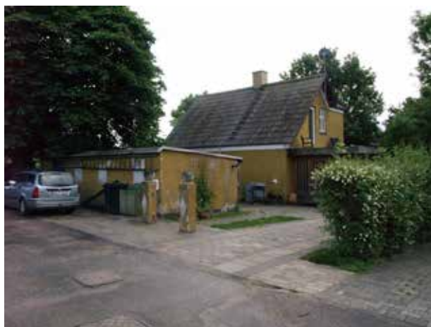
Eksempel på den oprindelige bebyggelse ved Nivå Station.

Syd for stationen på vestsiden af Niverødvej og jernbaneterrænet findes den allerførste bebyggelse i det som i dag kendes som Nivå. Bebyggelsen er fra omkring århundredskiftet og er i tråd med tidens tendenser udført som bedre byggeskik og nationalromantik.