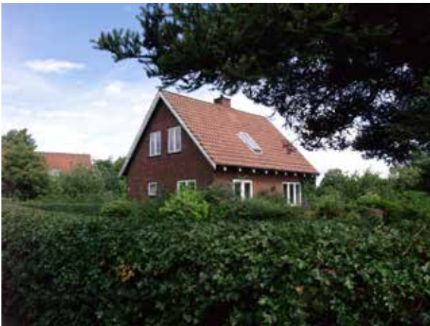
Typisk villa fra 1950'erne langs Niverødvej.