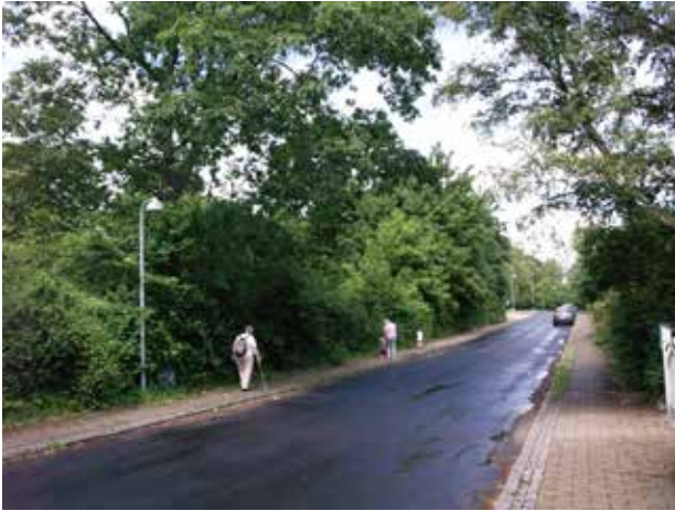
Niverødvej set fra syd.

Området kendetegnes af villaer tegnet fra omkring 1950 og frem. I parcelhuskvarteret er der eksempler på enkeltstående klassiske villaer fra 1950'erne.