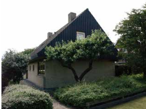
Hus af nyere dato på Vinkelvej.

Stationsområdet og de tilhørende stationsbygninger er vurderet til at have en høj bevaringsværdi på linie med den tidlige bebyggelse fra århundredeskiftet sydvest for Nivå Station.