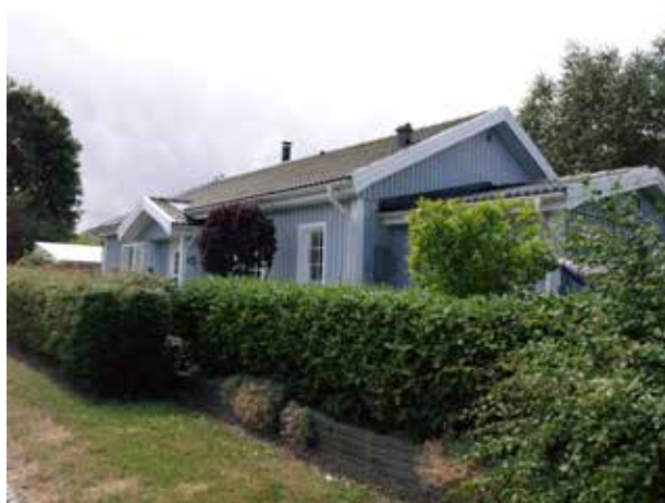
Ombygget og fornyet parcelhus på Vinkelvej.

Kulturmiljøet omfatter Nivå Station, en del af banelegemet ved stationen, den første bebyggelse i Nivå sydvest for stationen samt parcelhusområdet ved Nivå Stationsvej og Vinkelvej.