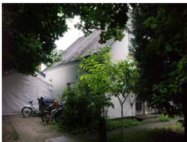
Det sydvestligste hus syd for Nivå Station skærmes af beplantning, så den tydelige sammenhæng i bebyggelsen fra århundredskiftet sløres.