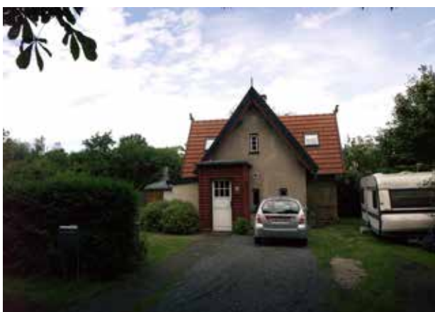
Et af de tidlige eksempler på boliger opført omkring århundredskiftet syd for Nivå Station. Også her findes klare nationalromantiske træk i bygningens arkitektur. Opført i tilknytning til banen.