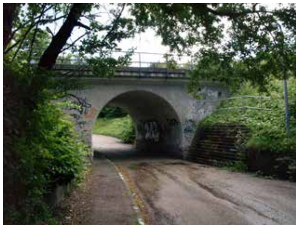
Stiforbindelse syd for Nivå Station på tværs af baneterrænet.

Syd for stationen på vestsiden af Niverødvej og jernbaneterrænet findes den allerførste bebyggelse i det som i dag kendes som Nivå. Bebyggelsen er fra omkring århundredskiftet og er i tråd med tidens tendenser udført som bedre byggeskik og nationalromantik.