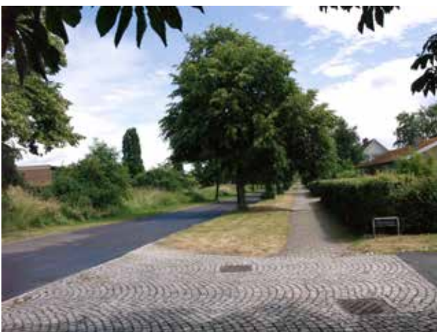
Kig langs Nivå Stationsvej