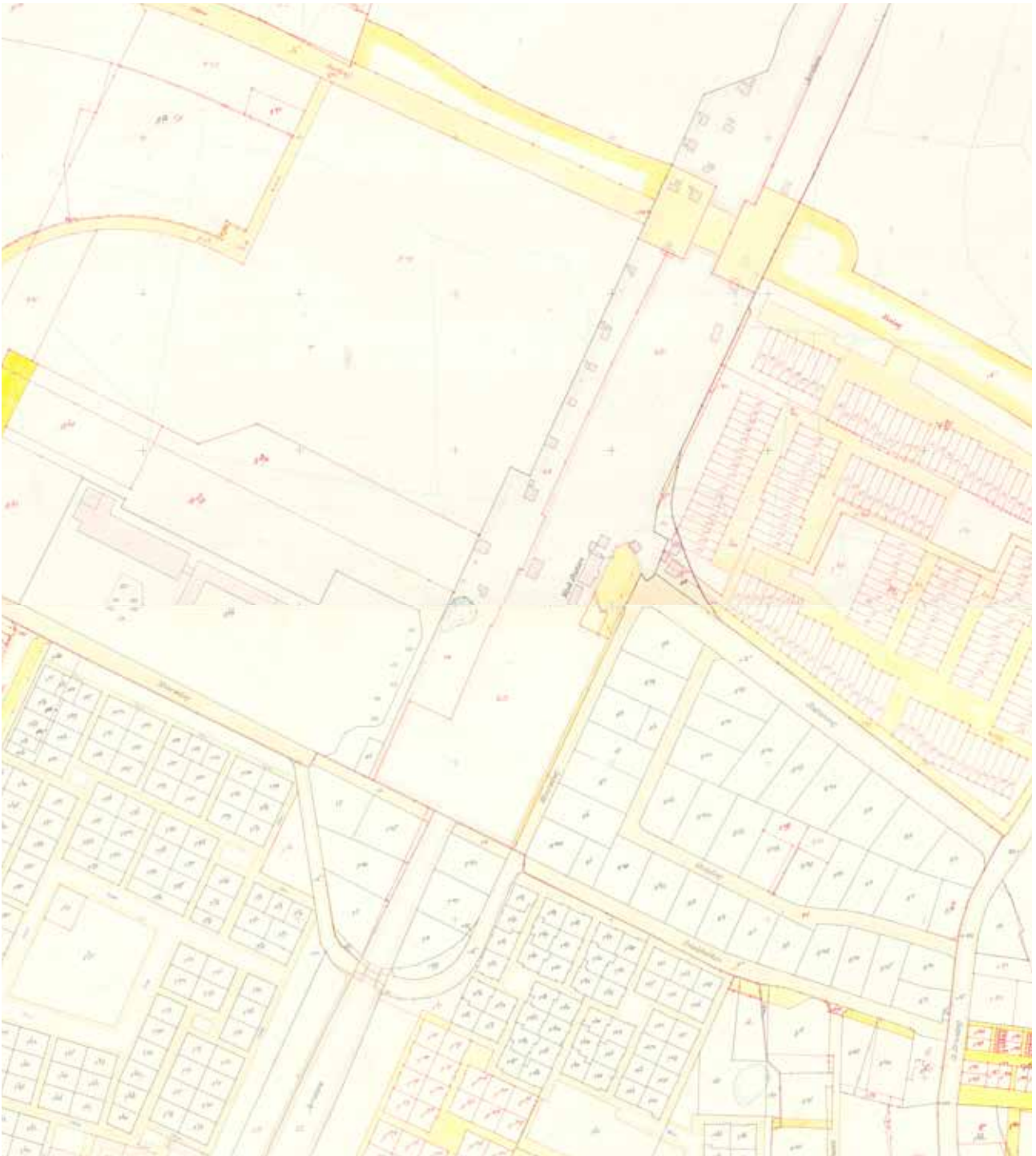
Kort over Nivå for perioden 1965-1995. Kortet er sammensat af to kort fra 1965 (øverst) og 1968 (nederst) og viser hvorledes parcelhusområdet fra 1950'erne er en del af en større samlet udbygning af Nivå.