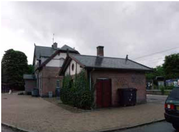
Nivå Station set fra nordøst. Stationsbygning og toilethus har sammen med tjenesteboligerne klare nationalromantiske træk.

Stationsbygningen og det dertil hørende toilet er områdets absolutte centrum og mest markante bygningsværk.