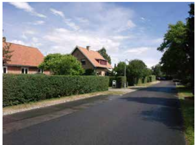
Klassiske eksempler på parcelhuse fra 1950'erne på Vinkelvej.