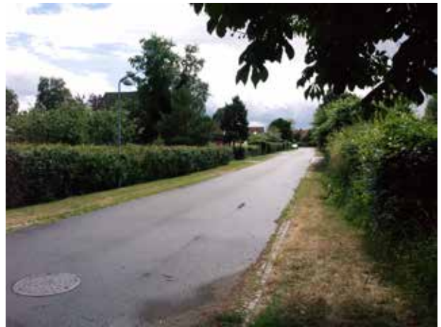
Vinkelvej karakteriseres af, at parcelhusene ligger let tilbagetrukket fra vejen.