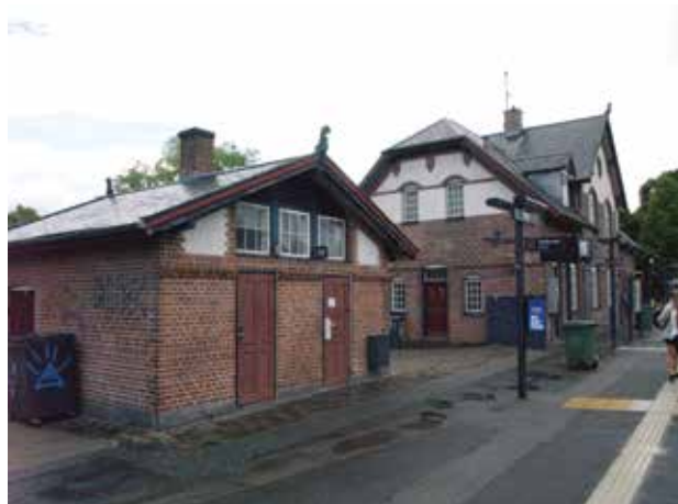
Nivå Station set fra nordvest.

De bærende værdier afspejler områdets tilblivelse og centrale funktioner og omfatter Nivå Station, stationsbebyggelsen sydvest herfor og bebyggelsesstrukturen i villaområdet øst for stationen.