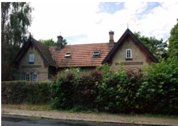
Tjenesteboliger ved Niverødvej, som har klare fællestræk med stationsbygningens nationalromantiske arkitektur. Opført i tilknytning til banen.