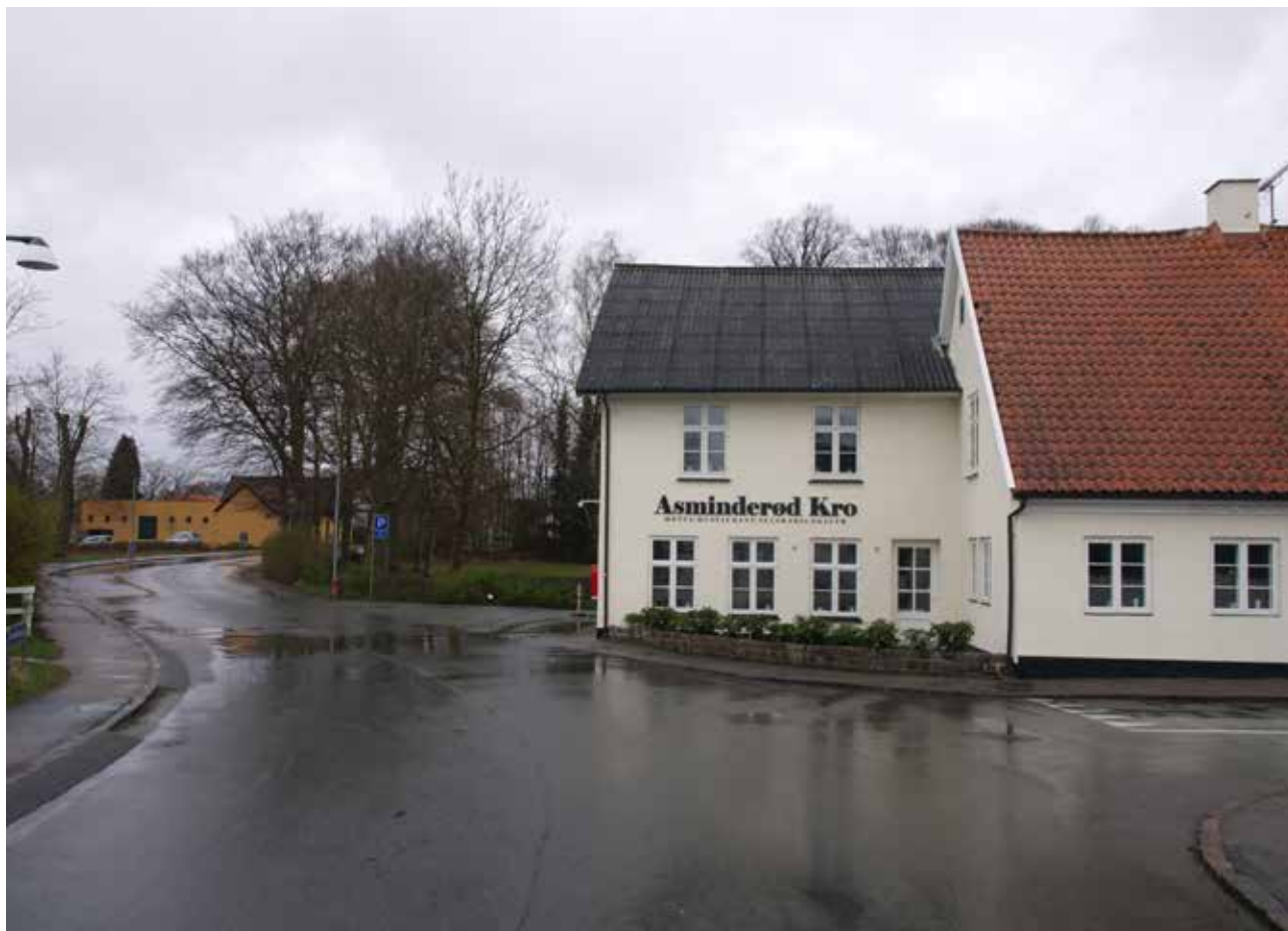
Asminderød Kro markerer landsbymidten med sin højde og beliggenhed lige hvor gaden knækker.

Områdets overordnede vejstruktur er ikke umiddelbart sårbar. Den visuelle sammenhæng fra Asminderødgade til Vinkelvej kunne eventuelt styrkes. Bebyggelsen er generelt sårbar over for istandsættelse, herunder særligt udskiftning af vinduer, dårligt tilpassede tagformer og oppudsning af murede facader. Karakteren især langs Asminderødgade hænger tæt sammen med bebyggelsesformen, og miljøet kan derfor ikke bære mange udskiftninger af ældre bebyggelse med ny, med mindre den nye bebyggelse nøje tilpasses i skala, form og placering.