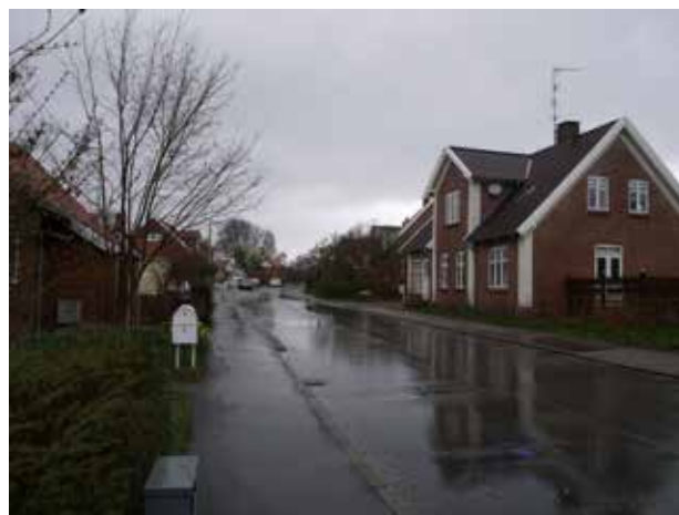
Toftegårdsvænget (øverst) bryder med det ellers fine, homogene miljø i Asminderødgade (nederst)

Bebyggelsen fremstår ret blandet. De ældste bevarede bygninger findes på Ved Dammen og Vinkelvej, hvor man finder typisk byggeskik med lave, stråttækte og hvidkalkede huse. Bebyggelsen langs Asminderødgade omfatter en lang række fritliggende huse, der spænder fra mere simple huse til egentlige villaer. Langs Præstevej ligger hovedsageligt lidt nyere huse fra starten af 1900-tallet, og her findes flere fine Bedre Byggeskik huse. Af landsbyens oprindelige gårde er kun enkelte delvist bevaret, først og fremmest præstegården.