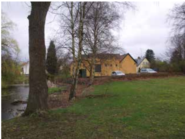
Det ene, bevarede gadekær ved den tidligere landsbyforde er et vigtigt træk i den velbevarede struktur.

Landsbyens tyngdepunkt var dog fortsat i den sydlige del, hvor kirken, kroen og to gadekær var samlet om en landsbyforde, der i store træk genfindes i dag som det grønne område ved Ved Dammen.