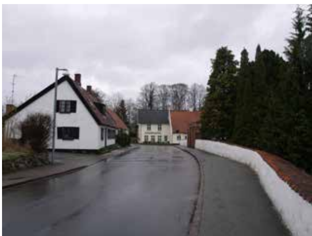
Kirkegårdsmur og kro giver bybilledet karakter og historisk forankring.

Landsbyens oprindelige vejstruktur var opbygget af en enkelt slynget landsbygade, der fortsatte mod nord mod Endrup og Veksebo. I den sydlige del forgrenede vejen sig med en gren mod øst til Langstrup og en mod sydvest til Grønholt. Ved anlæggelsen af Fredensborg blev der desuden ført en vej mod nord til slotsbyen. Den gamle forbindelse mod Endrup blev derved svækket. Med anlæggelsen af Benediktevej midt i 1900-tallet bliver den helt afskåret fra resten af landsbygaden.