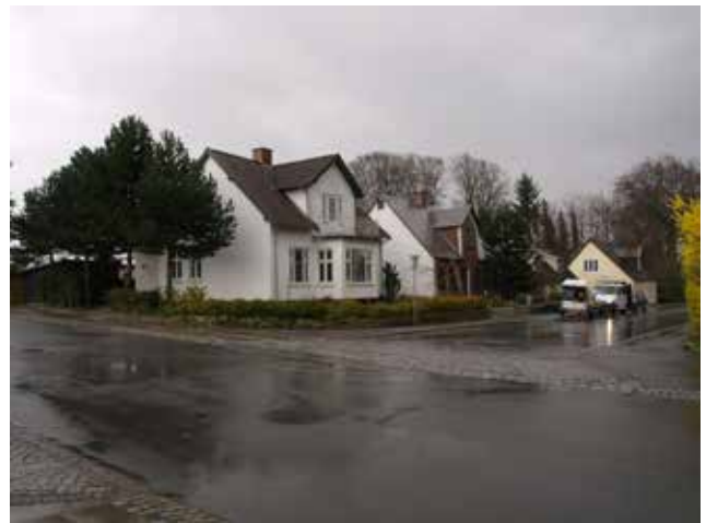
Rigt detaljeret romantisk hus på Ved Dammen (tv), og de mere ydmyge småhuse på Asminderødgade (th).