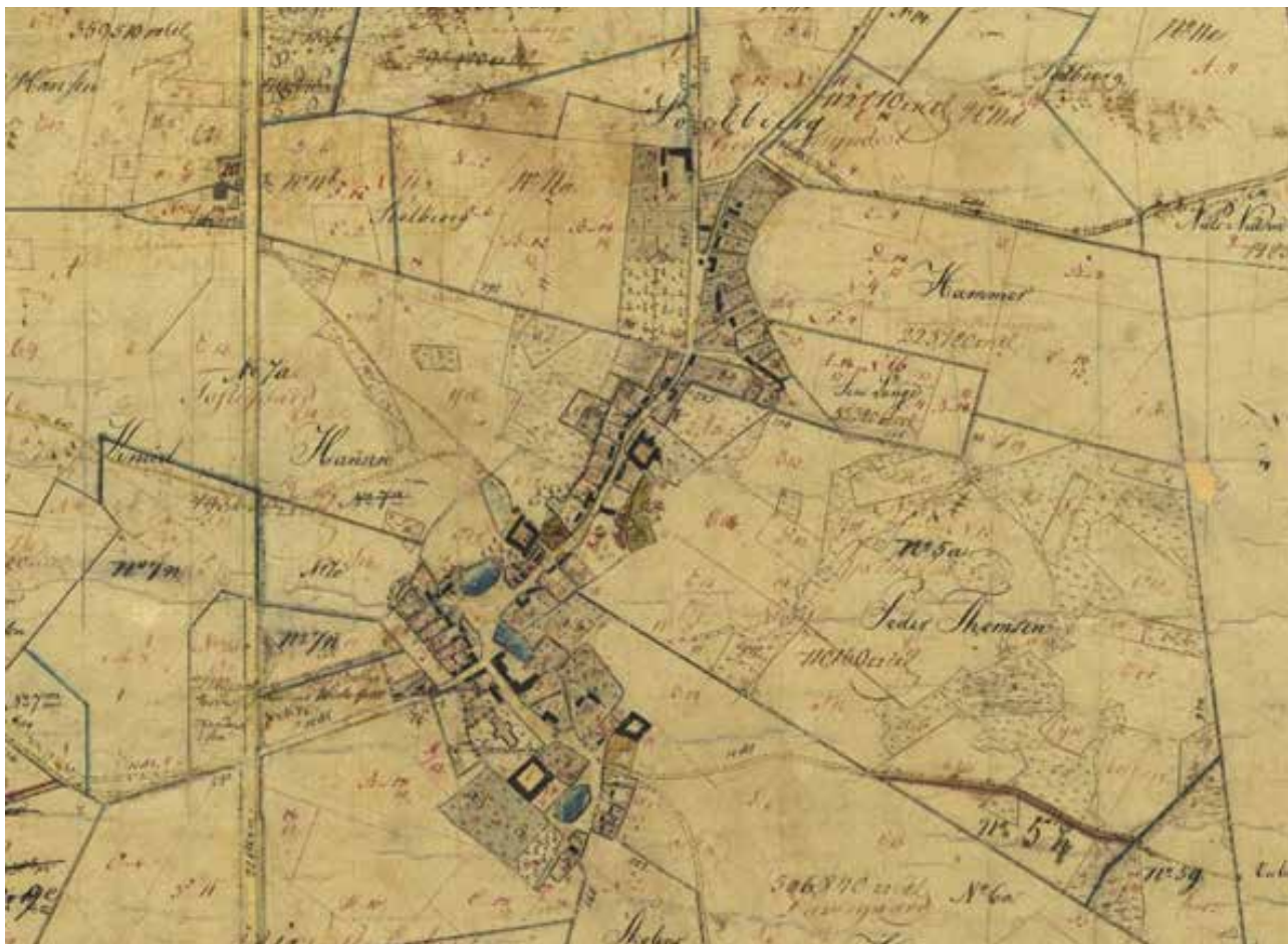
Asminderød 1813. Original 1 kort.

I slutningen af 1600-tallet opføres en kro i byen. Men den store udvikling kom med opførelsen af Fredensborg Slot i 1719-23. Kongen ville ikke tillade soldater og håndværkere at bosætte sig ved selve slottet, og de måtte i stedet indkvarteres i det nærliggende Asminderød. I 1749 nedbrændt store dele af landsbyen, herunder kroen, og ved genopførelsen fik landsbyen sit nuværende, mere bymæssige præg med en række småhuse, som blev opført langs vejen mod Fredensborg. Småhusene var i mange tilfælde boliger for pensionerede tjenestefolk fra slottet og håndværkere som forsynede hoffet. Asminderød er således fra dette tidspunkt ikke længere kun en landsby, baseret på landbrug, men