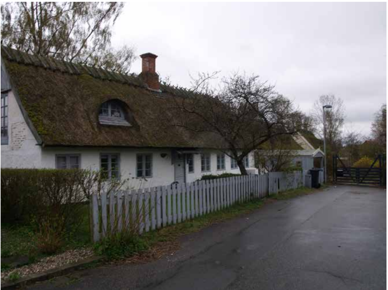
Nogle af byens ældste og mest velbevarede huse ligger på Vinkelvej.