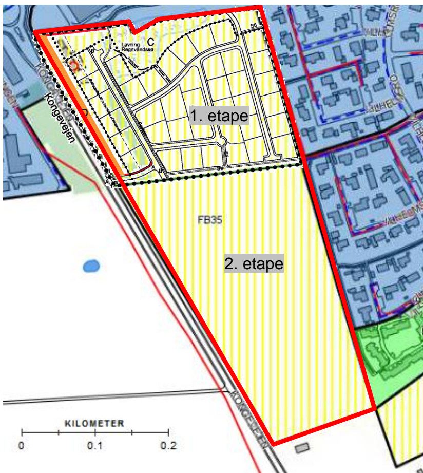
Figur 2. Kloakopland FB35 inkl. afmærkninger af 1. etape med de 38 planlagte boliger jf. Lokalplan nr. F114 for Fredensborg Kommune.

Kloakopland FB35 kloakeres for spildevand via et kloaksystem ejet af Fredensborg Forsyning A/S. Spildevandssystemet er ikke indtegnet i detaljer på kortet, men er beliggende i vejene.